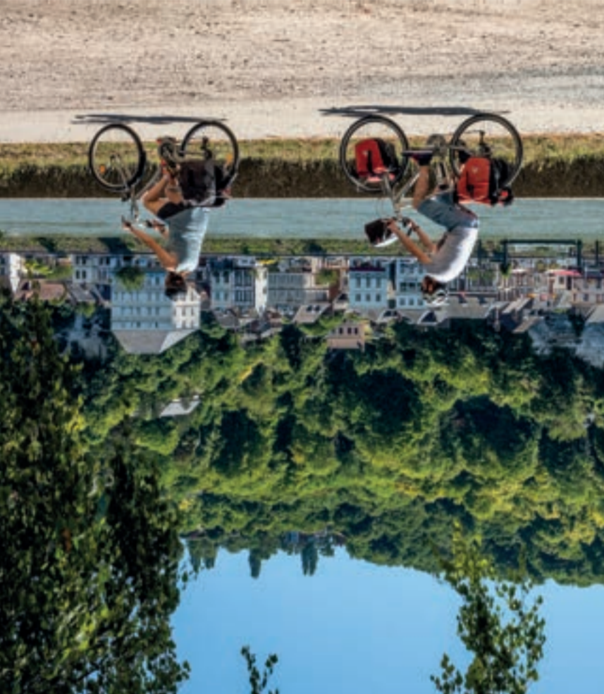
Tant de choses à vivre entre Paris et la mer